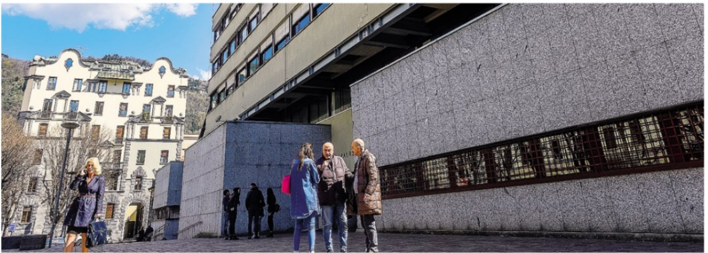
Il Tribunale di Como: le proiezioni confermano un trend di crescita nelle cause di lavoro rispetto allo scorso anno